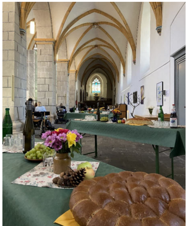
Schön gedeckte Tische für das Agapemahl im Seitenschiff der Florinskirche.