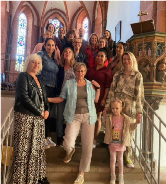
Das RegenbogenTeam in der Stiftskirche St. Goar.

Dem Team der Kita „Unter dem Regenbogen“ eine Oase und geistliche Impulse bieten, das war Ziel des Oasentages.