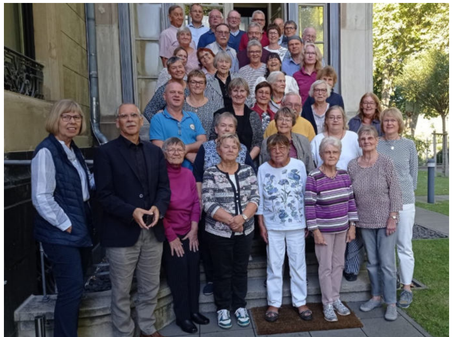
Die Gäste aus der Partnergemeinde Luckau mit ihren Gastgebern in der Superintendentur Koblenz.