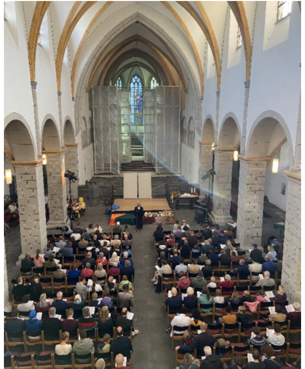
Der gut besuchte Familiengottesdienst zum Erntedank in der Florinskirche.

Allen Beteiligten ein herzliches Dankeschön!