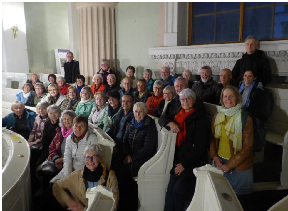
Die Koblenzer Reisegruppe während der Besichtigung der Nikolaikirche in Leipzig.