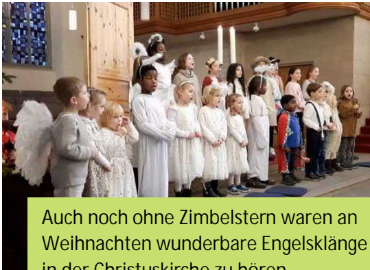
Auch noch ohne Zimbelstern waren an Weihnachten wunderbare Engelsklänge in der Christuskirche zu hören.