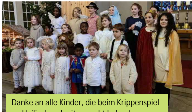
Danke an alle Kinder, die beim Krippenspiel an Heiligabend mitgemacht haben!